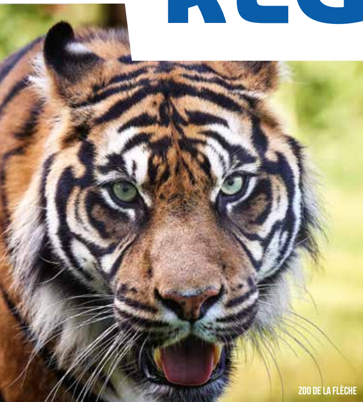
ZOO DE LA FLÈCHE