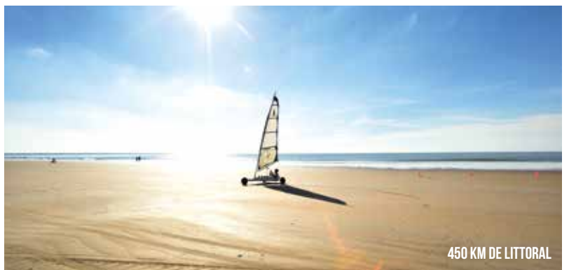
450 KM DE LITTORAL