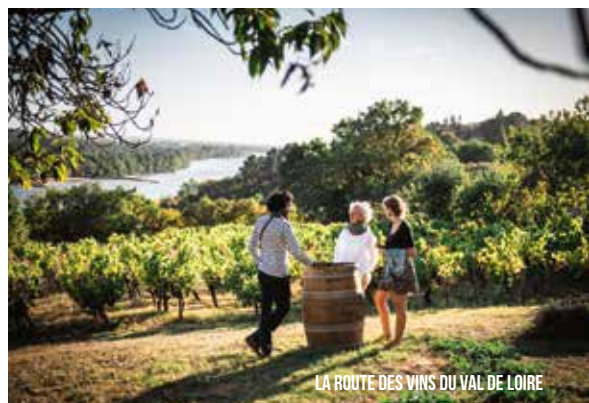
LA ROUTE DES VINS DU VAL DE LOIRE