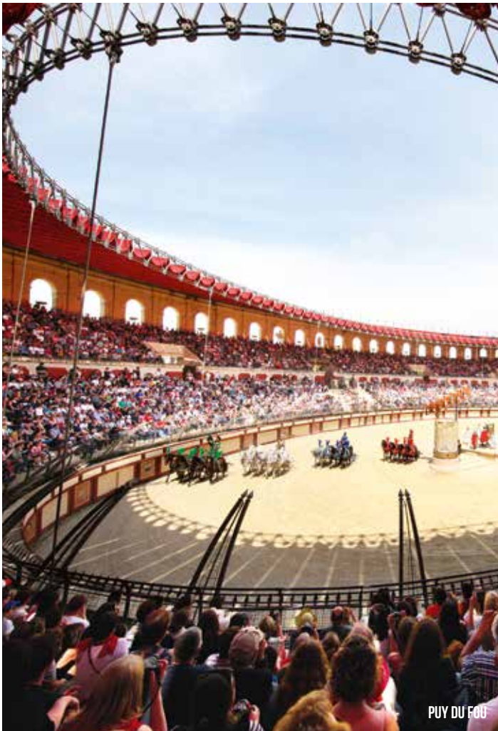
PUY DU FOU