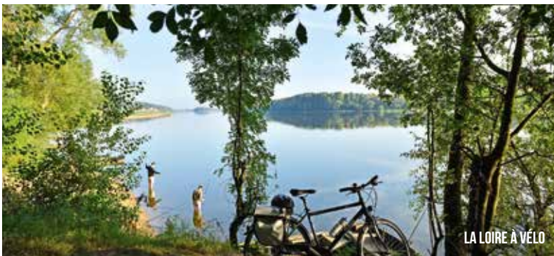
LA LOIRE À VÉLO