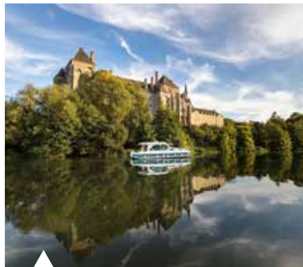
© Maxime Guillon - Sarthe Développement