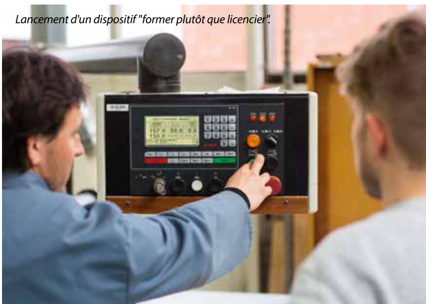
Lancement d'un dispositif "former plutôt que licencier".

Ce plan unique par son ampleur s'attache à apporter des réponses concrètes à l'urgence économique et sociale, sans perdre de vue les enjeux de plus long terme. D'autres mesures s'imposeront très probablement à la rentrée pour répondre, en lien avec l'État, à toutes les dimensions d'une crise qui, malheureusement, s'annonce très dure. Flexibilité et réactivité sont plus que jamais les maîtres-mots de cette période hors du commun.