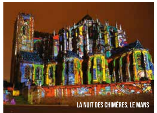
LA NUIT DES CHIMÈRES, LE MANS