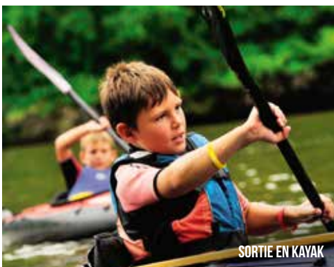
SORTIE EN KAYAK