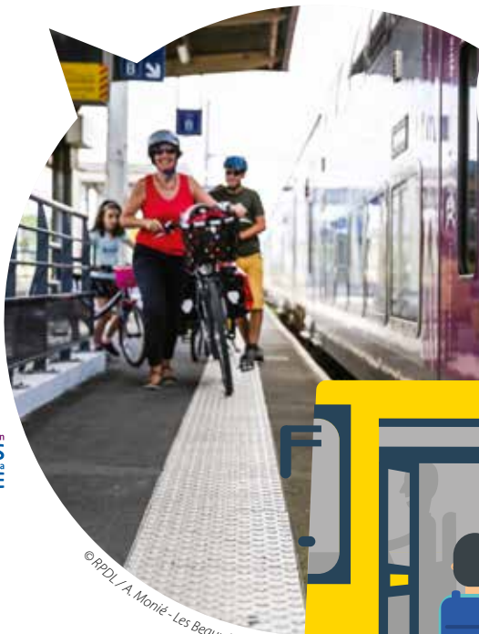
© RPDL / A. Monié - Les Beaux Matins