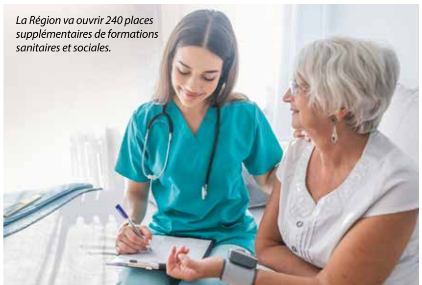
La Région va ouvrir 240 places supplémentaires de formations sanitaires et sociales.

Il comprend des propositions fortes, avec notamment l'augmentation de 20 % de l'offre de formation pour les demandeurs d'emploi ou le lancement du dispositif « former plutôt que licencier » afin d'aider les salariés et les entreprises à gagner en compétences et en polyvalence. La Région projette également de soutenir les TPE et PME par le biais d'un fonds régional d'investissement doté, dès cette année, de 25 millions d'euros. Objectif : développer la capacité d'investissement des entreprises et protéger les emplois. Par ailleurs, un effort considérable de 50 millions d'euros est proposé en direction des communes et des intercommunalités. Le but est de soutenir massivement l'investissement public local, partout sur les territoires. Le plan met également l'accent sur les relocalisations à travers un programme de soutien spécifique et une équipe dédiée pour accompagner les entreprises soucieuses de rapatrier leurs activités dans la Région.