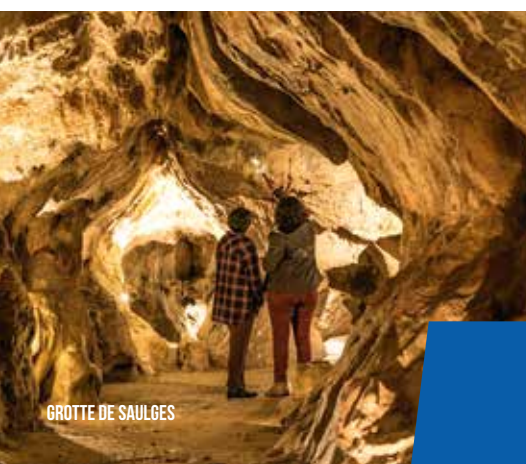
GROTTE DE SAULGES